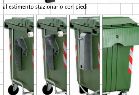
allestimento stazionario con piedi