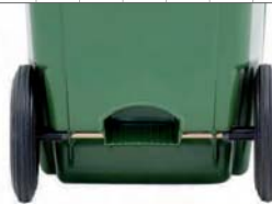
appoggio per movimentazione