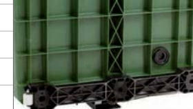
traverse di appoggio