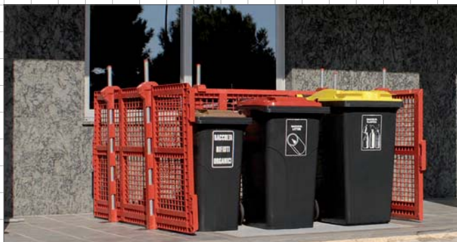
isola ecologica allestita con barriere Safetyplast