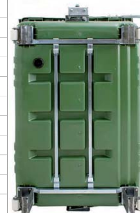
fondo rinforzato disponibile anche per il 1700