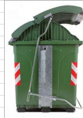
apertura coperchio asimmetrico