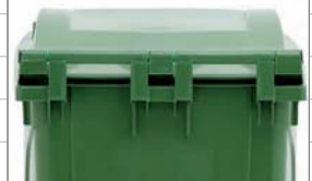
maniglie per movimentazione