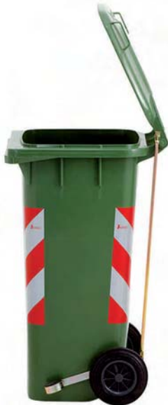
apertura con pedale