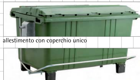
allestimento con coperchio unico