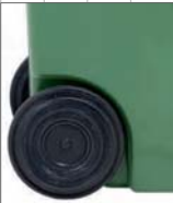
ruota a naso ø300