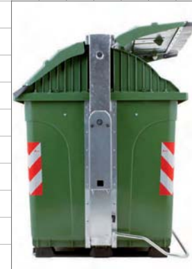
apertura coperchio simmetrico