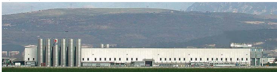
stabilimento Jcoplastic SpA di Battipaglia (SA)